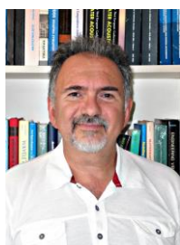
Μιχάλης Ταρουδάκης Καθηγητής Πανεπιστημίου Κρήτης Πρόεδρος Ελληνικού Ινστιτούτου Ακουστικής Πρόεδρος της Ευρωπαϊκής Ένωσης Ακουστικής

Το ΕΥΑΙΣΘΟ είναι ένα πρότυπο συνδυασμένο πρόγραμμα ηλεκτρονικής και συμβατικής ενημέρωσης των πολιτών για τα προβλήματα του θορύβου. Συντονίζεται από τον Αντιπρόεδρο του ΕΛΙΝΑ, Αν. Καθηγητή του Δημοκρίτειου Πανεπιστημίου Θράκης Νίκο Μπάρκα τον οποίο ευχαριστώ θερμά για την δημιουργική του παρέμβαση στο τόσο σημαντικό αυτό θέμα δημόσιας υγείας. Ευχαριστώ θερμά επίσης την Επιτροπή Ερευνών του Δημοκρίτειου Πανεπιστημίου Θράκης και όλους τους φορείς που συνδιοργανώνουν και υποστηρίζουν τις ημερίδες ευαισθητοποίησης έναντι του θορύβου και ελπίζω ειλικρινά το μήνυμα που θέλει να μεταφέρει το ΕΛΙΝΑ στους πολίτες να εισακουστεί και να κατανοηθεί. Χρειαζόμαστε ένα καλύτερο και πιο ήσυχο περιβάλλον για το μέλλον το δικό μας και των παιδιών μας.